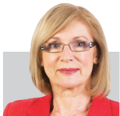
ДЖЕН О'СЪЛВИНЪ, министър на образованието на Ирландия:

Е-портфолиото трябва да стигне до всяка класна стая и всеки ученик. То помага децата да упражняват дигиталните си умения. Докато работят по английски език или математика, те могат да се занимават и с интердисциплинарни задачи, които обогатяват общата им култура. Дигиталната платформа може да се използва за преговор в началото на следващата година.