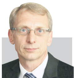
Проф. д.х.н. НИКОЛАЙ ДЕНКОВ, зам.-министър на образованието и науката:

Размерът на вложението във висшето образование е важен, но още по-важен е ефектът от това вложение. Парите за издръжката на един студент следват качеството на подготовката му и реализацията като специалист. До 2020 г. 60% от средствата ще се разпределят според реализацията на студентите.